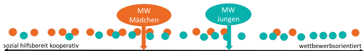
Abbildung 1. Verteilung von Verhaltensweisen.

Biologische Unterschiede zeigen sich z.B. früh in der Kindheit in unterschiedlichen Vorlieben im Spielverhalten, die teilweise gängigen Zuschreibungen von männlichen und weiblichen Verhalten (s.u. Stereotype) entsprechen, z.B. dass Mädchen eher kooperativ und sozial, Jungen dagegen wettbewerbsorientiert sind. Diese Vorlieben im Spiel aber sind nicht so ausgeprägt, dass sie die Verhaltensunterschiede in ihrer Gesamtheit erklären können. Der Überlappungsbereich zwischen Mädchen und Jungen ist sehr groß (Abbildung 1).